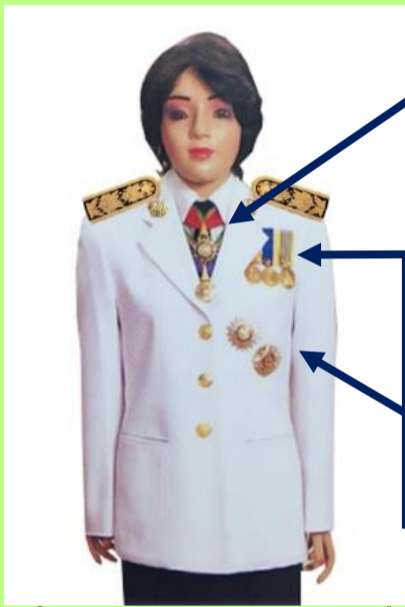
เครื่องแบบเต็มยศและครึ่งยศ (ประดับเครื่องราชอิสริยาภรณ์เหมือนกัน)

เช่น ท.ช., ท.ม. (เดิมประดับหน้าบ่าเสื้อมิตดารา)