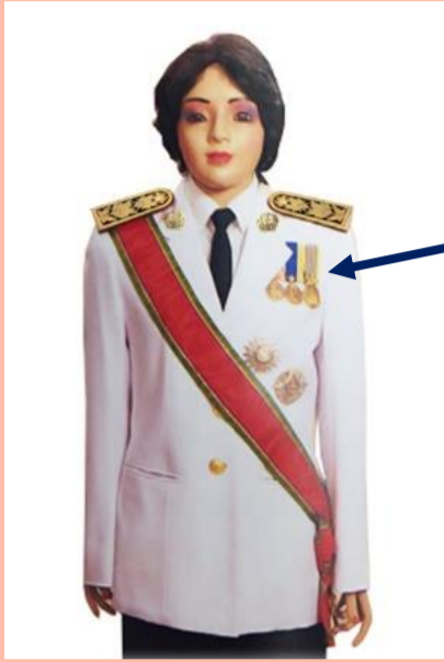
เครื่องแบบเต็มยศ

ประดับดารา ดวงตรา และสวมสายสะพายเช่นเดิม