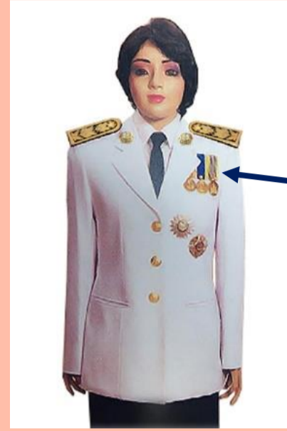
เครื่องแบบครึ่งยศ

เหรียญราชอิสริยาภรณ์ เช่น เหรียญจักรพรรดิมาลา เหรียญที่พระราชทานเป็นที่ระลึก ในโอกาสต่าง ๆ ให้ประดับโดยใช้แพรแถบ แบบบุรุษ