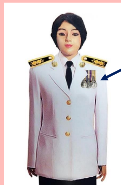
เครื่องแบบเต็มยศและครึ่งยศ

ประดับแพรแถบ เหรียญที่พระราชทานเป็นที่ระลึก ในโอกาสต่าง ๆ แบบบุรุษ ที่อกเสื้อเบื้องซ้าย