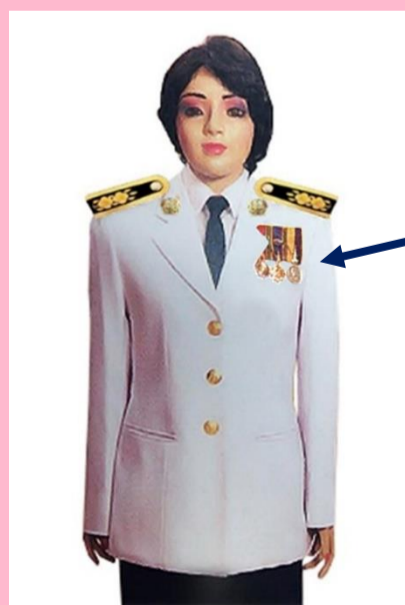
เครื่องแบบเต็มยศและครึ่งยศ (ประดับเครื่องราชอิสริยาภรณ์เหมือนกัน)

เช่น จ.ช., จ.ม., บ.ช., บ.ม., ร.ท.ช., ร.ท.ม., ร.ง.ช., ร.ง.ม.